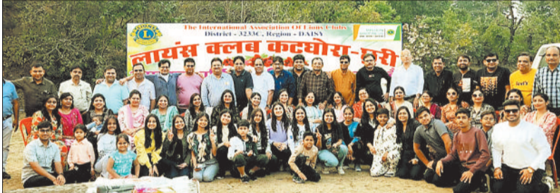
पिकनिक में उपस्थित लायन्स क्लब के सदस्य।