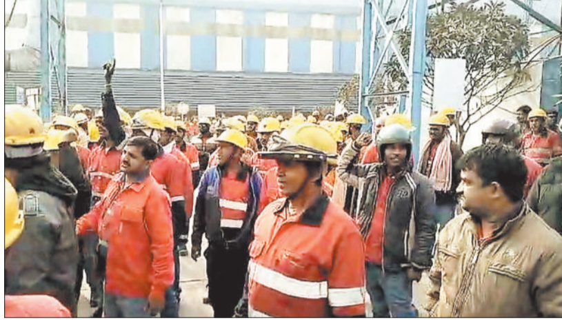
बालको संयंत्र के अंदर मांगों को लेकर प्रदर्शन करते टेका श्रमिक।

विश्वसनीय सूत्रों से मिली जानकारी के अनुसार बालको संयंत्र के अधीन काम करने वाले टेका कर्मी अपनी विभिन्न मांगों को लेकर 31 दिसंबर से बालको गेट के मुखद्वार पर धरना प्रदर्शन कर रहे थे। जिसकी वजह से बालको प्रबंधन का काम बुरी तरह से प्रभावित हो रहा था। टेका श्रमिकों की हड़ताल