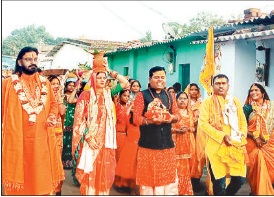
शोभायात्रा में उपस्थित आचार्य व ग्रामीण।