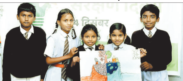
पेंटिंग के साथ विजयी प्रतिभागी बच्चे।