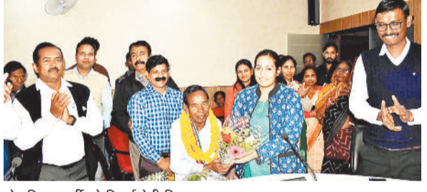
सेवानिवृत्त कर्मी को विदाई देती निगम आयुक्त।