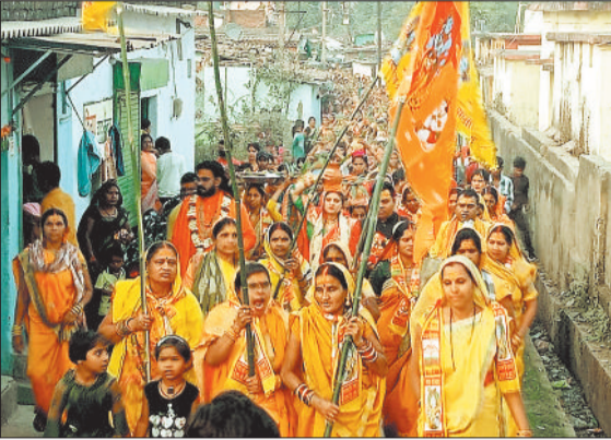
गांव की गलियों में निकाली गई कलशयात्रा।