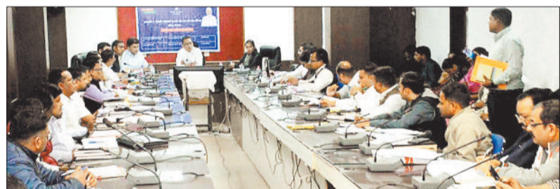
बैठक में उपस्थित अधिकारी।

कलेक्टर ने प्रधानमंत्री जनमन योजना के क्रियान्वयन स्थिति की जानकारी लेते हुए जिले के चिन्हांकित सभी समुदाय के लोगों को प्रधानमंत्री जनमन योजना का लाभ दिलाने मिशन मोड में कार्य करने की बात कही। उन्होंने