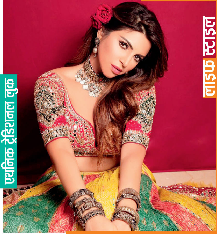
एथनिक ट्रेडिशनल लुक

शमा सिकंदर अपने स्टाइल से फैस करती रहती हैं। ये कहना गलत नहीं होगा कि शमा टीवी की दुनिया की सबसे खूबसूरत एक्ट्रेस में से एक हैं। शमा सोशल मीडिया पर काफी एक्टिव रहती हैं। एक्ट्रेस हर दिन अपनी नई-नई तस्वीरों से फैस को ट्रीट देती रहती हैं। वो कभी अपने बोल्ड लुक से तो कभी ट्रेडिशनल लुक से होश उड़ाती रहती हैं। शमा ने अपने लेटेस्ट एथनिक लुक की तस्वीर शेयर की हैं। ट्रेडिशनल लुक में वो सिंपल तो लग रही पर बला की खूबसूरत भी लग रही हैं।